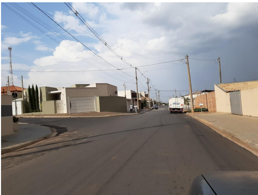
Rua Mal. Floriano Peixoto – Entre Av. Narciso Biancardi e Av. Sebastião Garcia