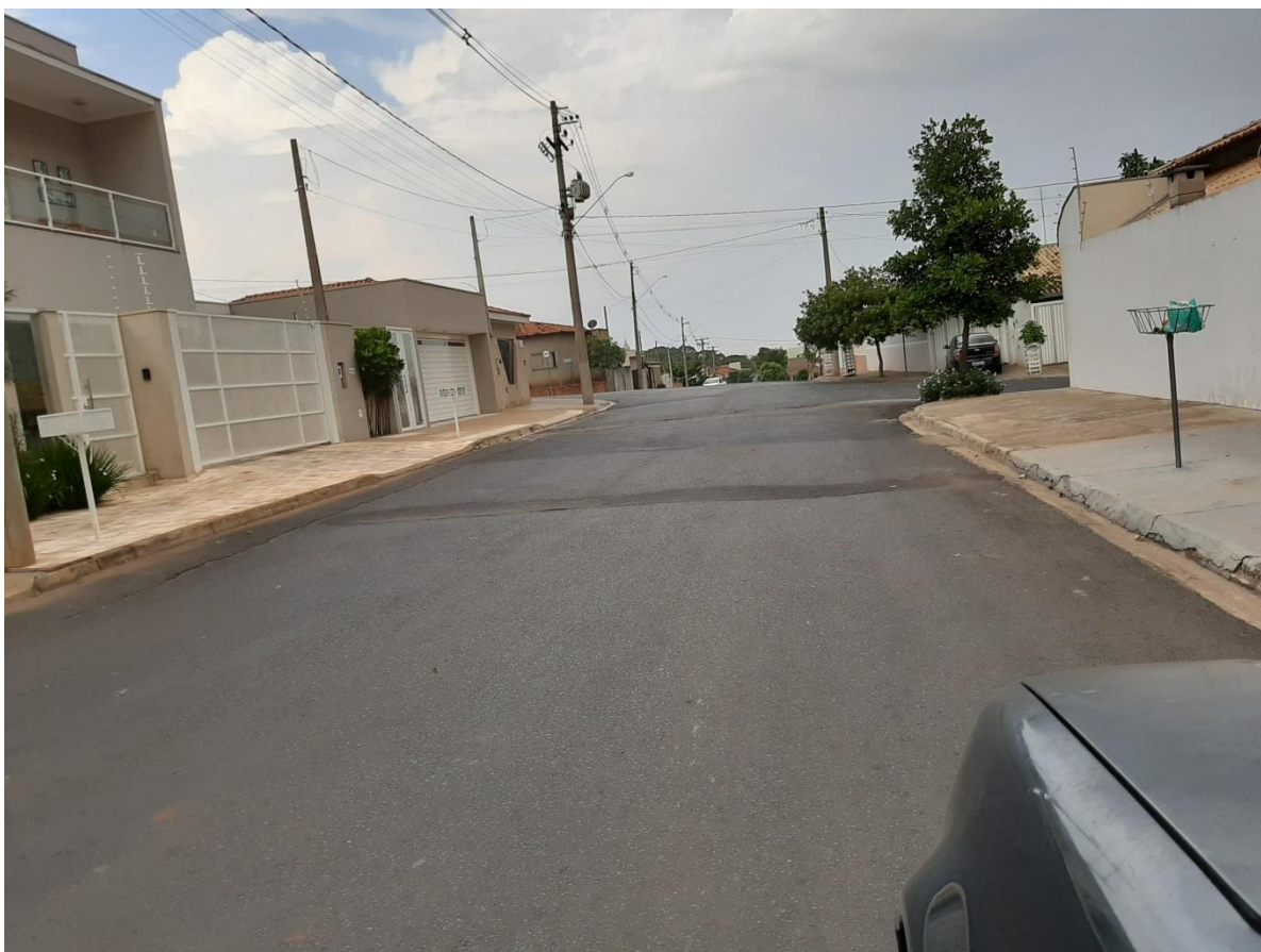
Rua Mal. Floriano Peixoto – Entre Av. Pitelli Buck e Av. Augusto Bailão