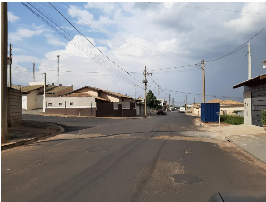
Rua Mal. Floriano Peixoto – Entre Av. João Albani e Av. Maria Ribeiro Garcia

TRECHO 02: RUA MAL. FLORIANO PEIXOTO ENTRE AV. NARCISO BIANCARDI, AV. SEBASTIÃO GARCIA, AV. PROF.ª THEREZA BAILÃO GALETTI, AV. ARMELINDA PITELLI BUCK, AV. AUGUSTO BAILÃO ATÉ AV. SILVIO VANZATO