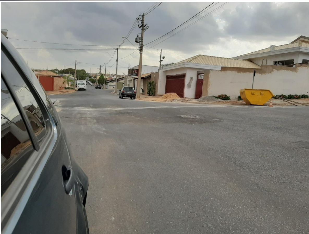
Rua Mal. Floriano Peixoto / Av. Armelinda Pitelli Buck (Aplicação de Binder)