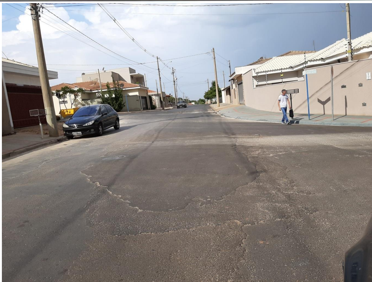
Rua Mal. Floriano Peixoto – Entre Av. Profª Thereza Bailão Galetti e Av. Armelinda Pitelli Buck