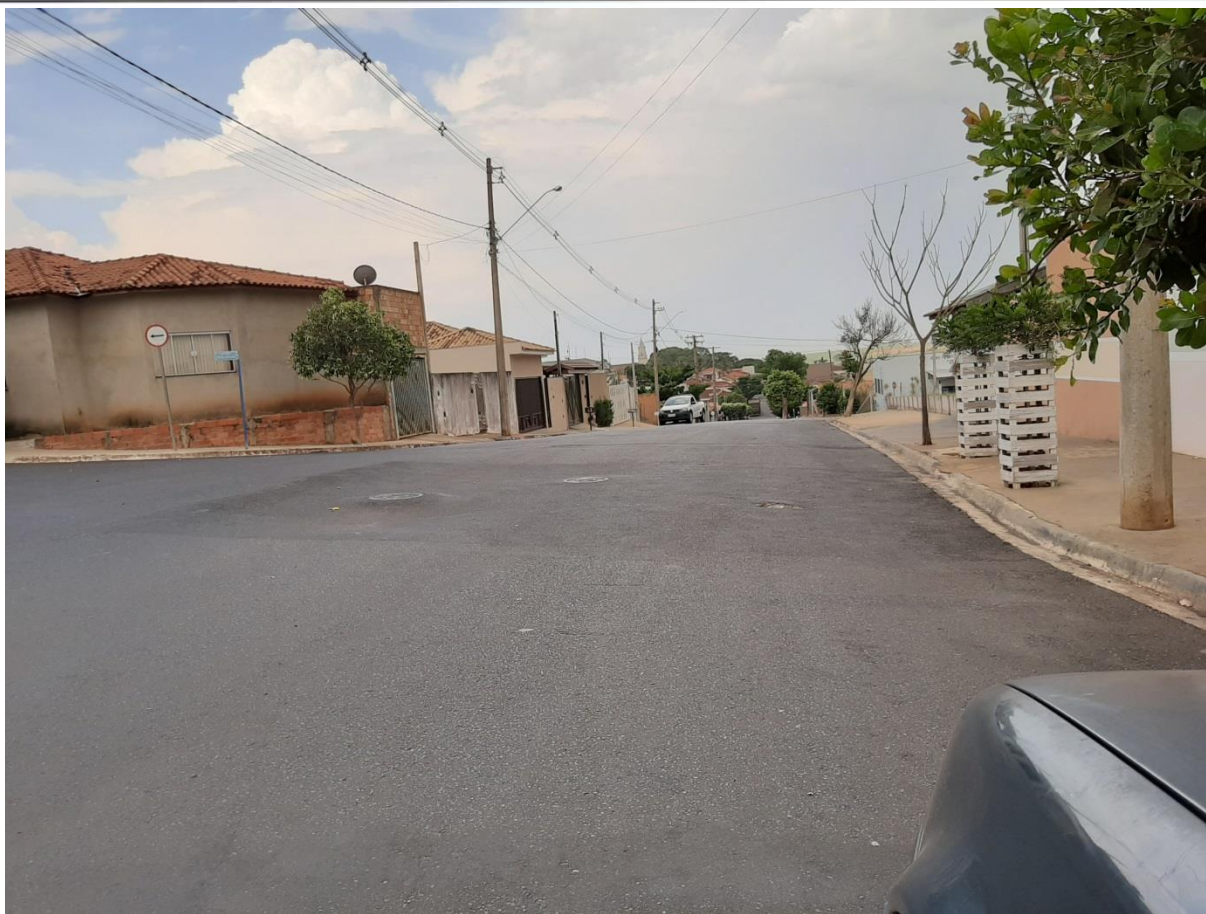
Rua Mal. Floriano Peixoto / Av. Silvio Vanzato (Aplicação de Binder)